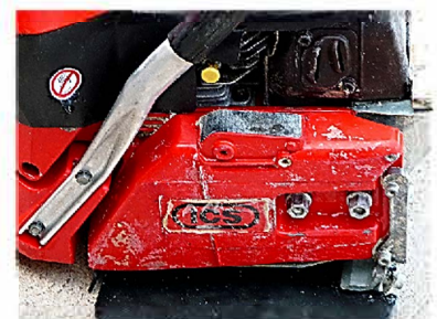
APRES - 20 minutes