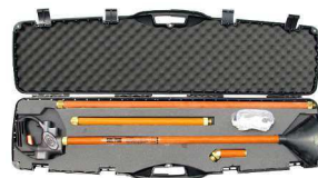
Coffret de transport rigide ou souple en option